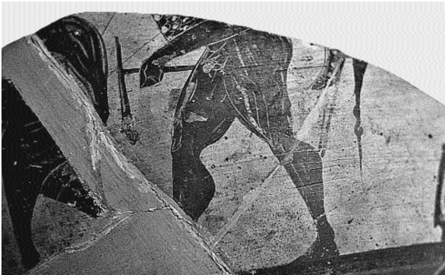
Fig. 2. Bérézan, KAFI 17126. Détail du personnage central.